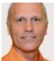
Gerald Holzmüller Kamera