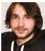
Jakob Reimer Technik, Schnitt