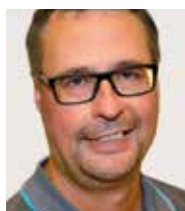
Peter Weishäupl Kamera