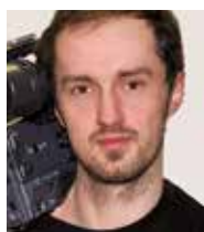
Dominik Grüner Kamera, Schnitt